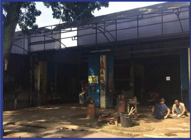
AMA WORKSHOP KARAPITAN