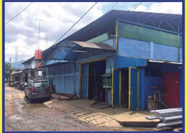
CV. AMA WORKSHOP GEDEBAGE