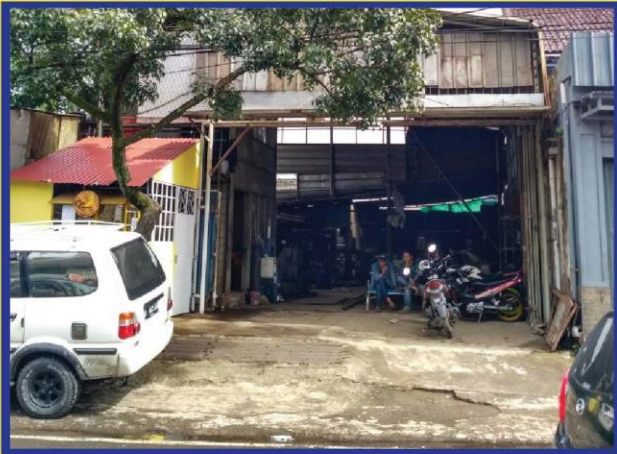
SOBIB TEKNIK. I